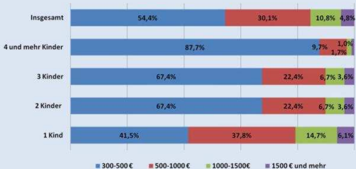
Elterngeldansprüche von Müttern im ersten Bezugsmonat (in Höhe von .. bis unter ... €)

Datenquelle: Statistisches Bundesamt: Öffentliche Sozialleistungen: Statistik zum Elterngeld – gemeldete beendete Leistungsbezüge 2. Vierteljahr 2009, Wiesbaden 2009; T9 – eigene Berechnungen.